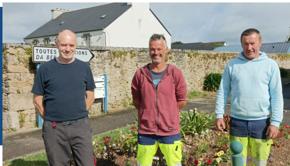
Les agents des services techniques

Dans la commune, une équipe d'agents municipaux œuvre chaque jour avec professionnalisme, engagement pour assurer le bon fonctionnement des services publics.