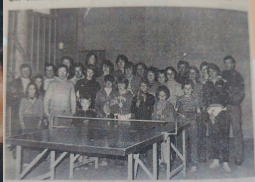
SAINT-DIVY : Un club de tennis de table créé prochainement