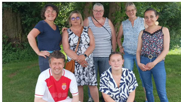
Les agents des services périscolaires et d'entretien

Ils assurent un lien direct entre la commune et ses citoyens, tout en garantissant une gestion rigoureuse des affaires communales.