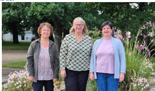
Les agents du service administratif

Ils assurent des missions essentielles à la sécurité, à la propreté et au cadre de vie de tous.