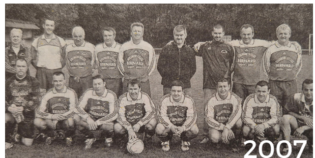
2007 : dernier match joué sur le terrain du bourg

En 2006, l'inauguration du complexe sportif du Valy Lédan marque un tournant majeur. Cet équipement offre au club des conditions de pratique à la hauteur de son dynamisme. L'abandon progressif de l'ancien terrain du bourg, chargé d'histoire et d'émotion, symbolise la fin d'une époque et l'entrée dans une nouvelle ère.