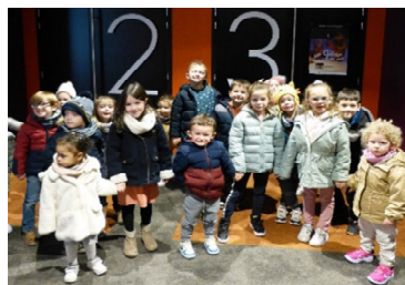
Plijadur zo bet !