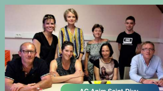
AG Anim Saint-Divy