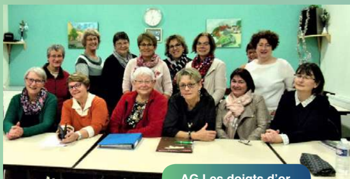
AG Les doigts d'or