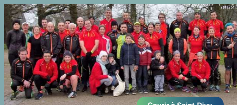
Courir à Saint-Divy