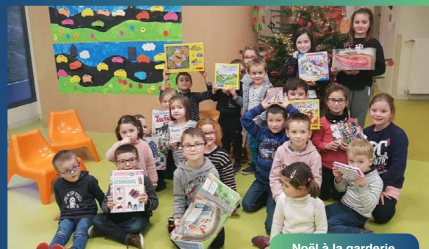
Noël à la garderie