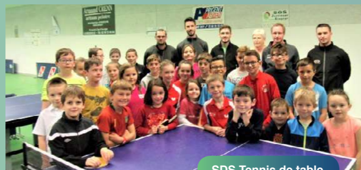
SDS Tennis de table