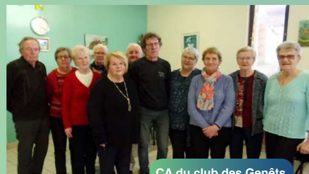
CA du club des Genêts