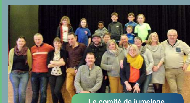
Le comité de jumelage