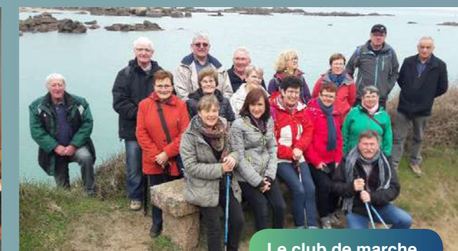
Le club de marche