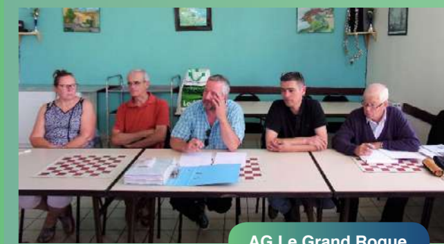
AG Le Grand Roque