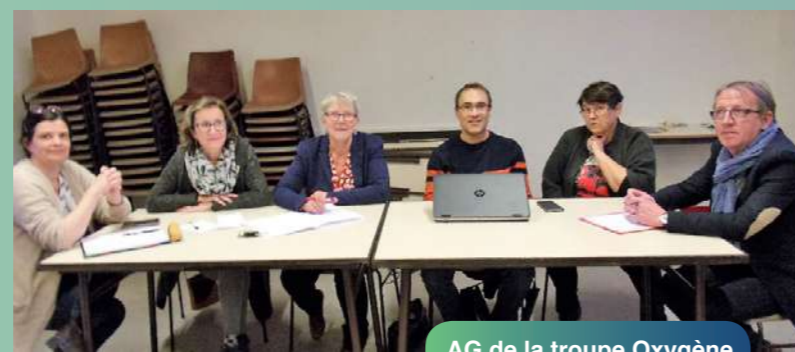
AG de la troupe Oxygène