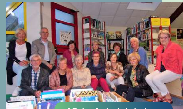
AG des Amis de la lecture