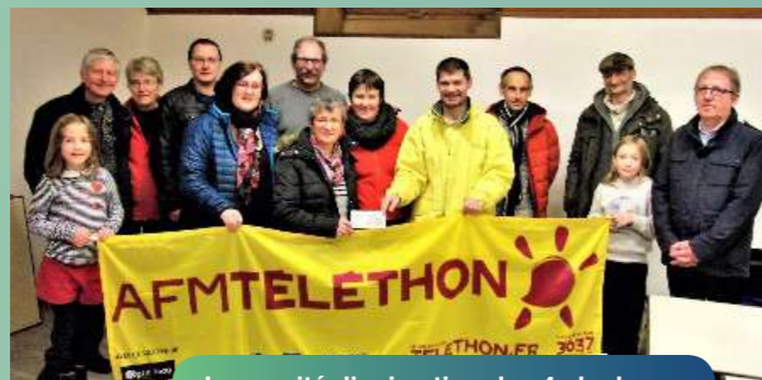
Le comité d'animation des 4 clochers