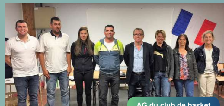
AG du club de basket