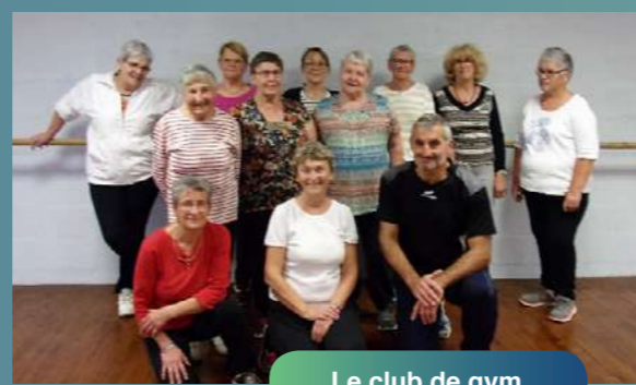
Le club de gym