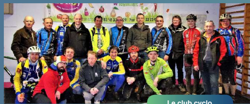
Le club cyclo